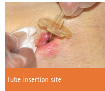
Tube insertion site