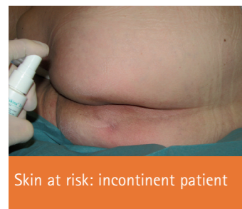
Skin at risk: incontinent patient