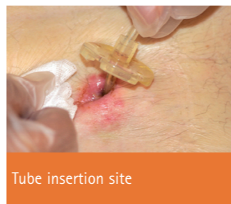
Tube insertion site