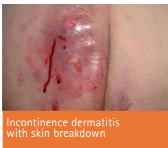
Incontinence dermatitis with skin breakdown